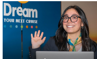
Future Cruise Consultant